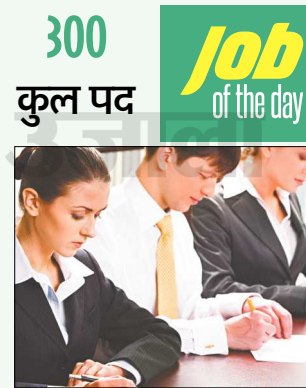
गए निर्देशों के अनुसार ऑनलाइन आवेदन प्रक्रिया पूरी करें।

अंतिम तिथि: ऑनलाइन आवेदन करने की अंतिम तिथि 06 सितंबर, 2018 निर्धारित है।